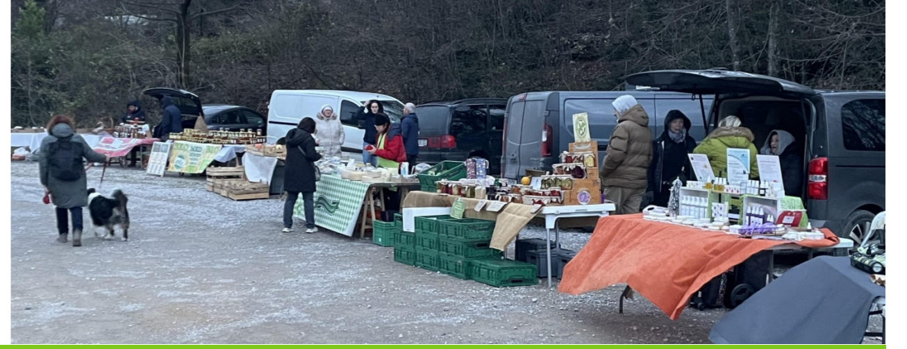
كاستاف، شبوروا جاما، ديسمبر 2025

مرتين في الشهر (كل ثاني يوم اثنين من الشهر (بعد الظهر) وآخر سبت من الشهر (صباحا))