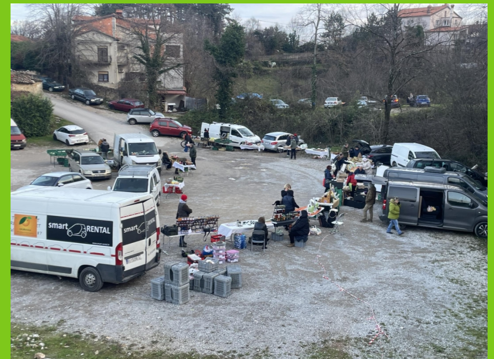
كاستاف، شبوروا جاما، ديسمبر 2025

سلسلة القيمة المعنية (التوريد) سلسلة إمداد غذائية قصيرة (من المزارع إلى المشتري)، مزارعون من جميع أنحاء كرواتيا وحتى من سلوفينيا.