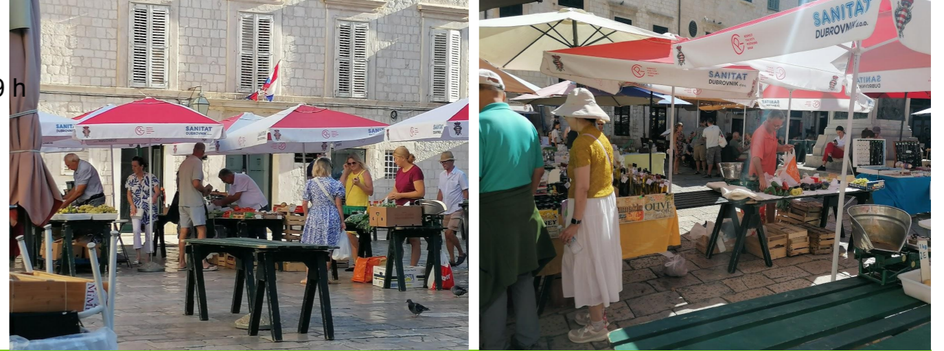
Gundulićeva poljana, Dubrovnik, septembre 2025, photos prises par Jelena Ivanišević

Fréquence les jours Tous (sauf le dimanche)